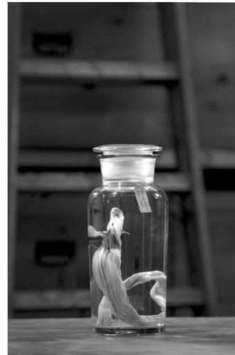
Ólöf Nordal Alca impennis ♀ Island 1844 Spiseror og mave af hunfuglen 2016. Ljósmynd 60 × 90 cm